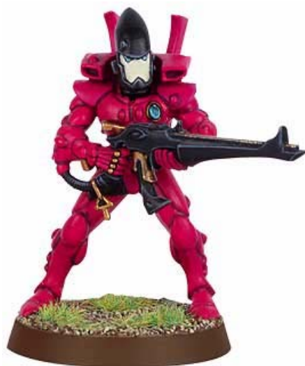
Gardien aux couleurs d'Altansar

Les couleurs traditionnelles d'Altansar sont un rouge profond, avec des détails noirs.