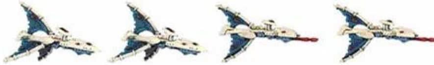
Shadow Hunters Eldars

Maugan Ra combattait à bord du Shadow Hunter Tal'Kevyr contre des Raiders Idolators du Chaos qui harcelaient Altansar, dont les moteurs luttèrent à plein régime contre l'attraction fatale du puits gravitationnel de l'Oeil de la Terreur. Une explosion illumina silencieusement l'arrière du vaisseau-monde, qui entama une lente plongée déchirante vers le warp. Le vaisseau-monde Iyanden, qui luttait également non loin, dépêcha immédiatement ses propres chasseurs pour recueillir les petits vaisseaux d'Altansar qui luttèrent encore contre la flotte du Chaos. Las, la progression de la flottille de secours était fortement ralentie par les précautions à prendre pour ne pas se retrouver à son tour aspirée dans l'Immaterium, et quand ils arrivèrent sur place, les assaillants chaotiques s'étaient déjà retirés et les chasseurs Altansars étaient détruits. Un seul Eldar put être recueilli, sa combinaison ayant miraculeusement résisté à l'explosion de son Shadow Hunter : Maugan Ra.